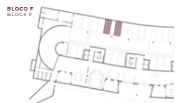
PISO CAVE -1 BASEMENT FLOOR -1