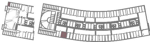
CAVE -2 FLOOR -2

ESTACIONAMENTO PARKING 2 LUGARES + 1 ARRUMO 2 SPOTS + 1 STORAGE