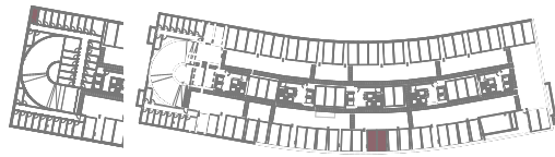
CAVE -3 FLOOR -3

ESTACIONAMENTO PARKING 2 LUGARES + 1 ARRUMO 2 SPOTS + 1 STORAGE